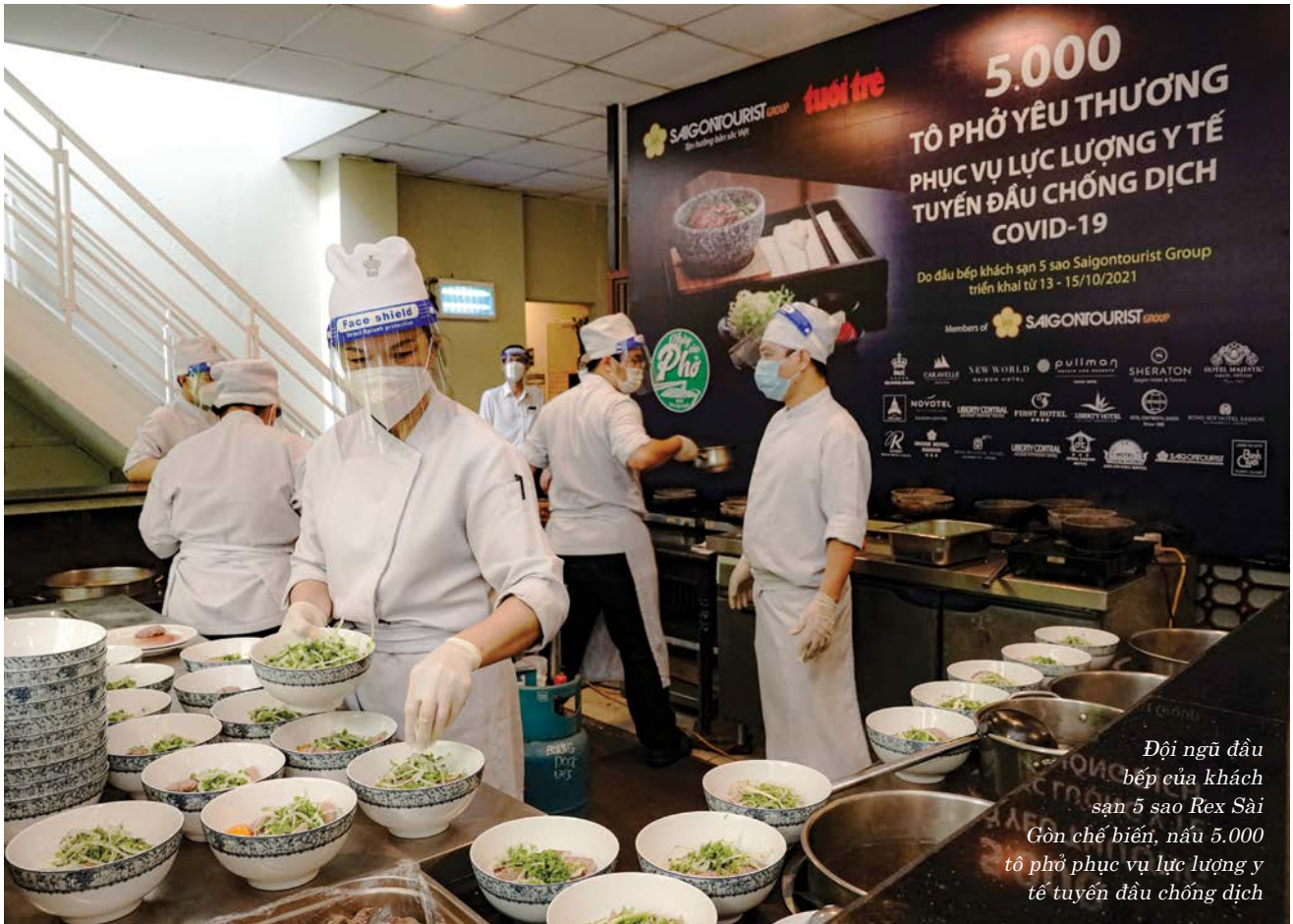
Đội ngũ đầu bếp của khách sạn 5 sao Rex Sài Gòn chế biến, nấu 5.000 tô phở phục vụ lực lượng y tế tuyến đầu chống dịch