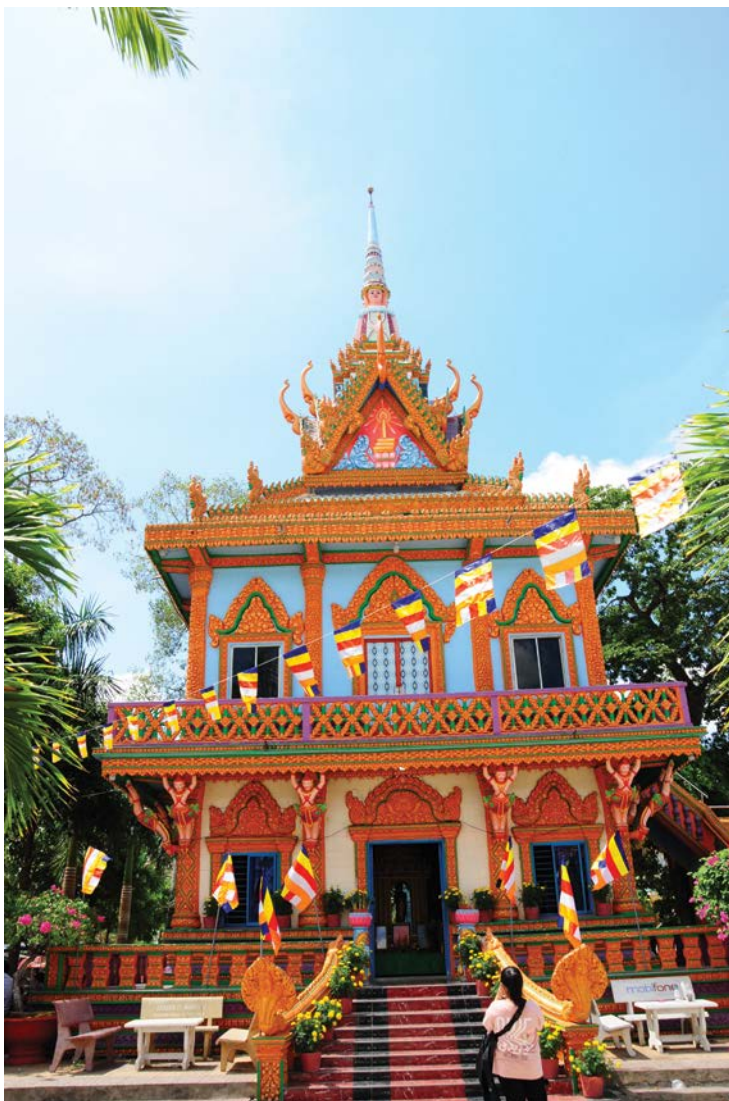
Text & photos: LAM LINH

Going to Soc Trang without visiting the pagoda, enjoying the food, or immersing in the traditional Khmer culture and inviting lyrics, may as well be considered as having not gone at all. In particular, sightseeing at the temple in Soc Trang is an unforgettable experience.