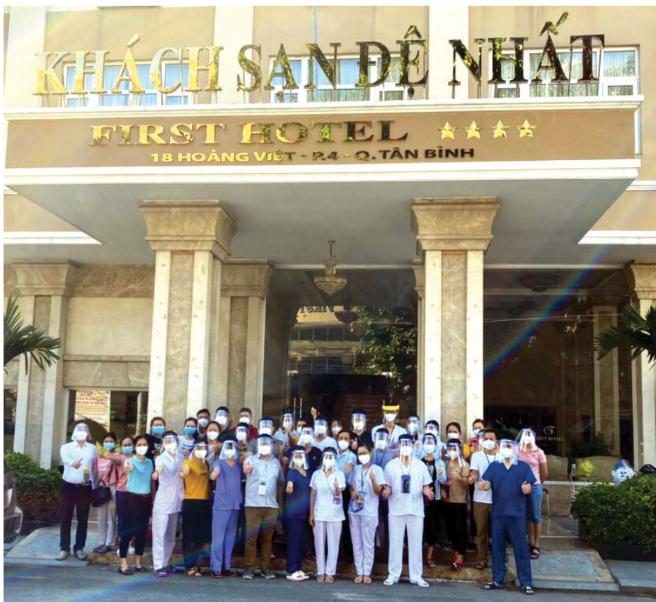
Khách sạn thuộc Saigontourist Group tại TP.HCM tham gia hỗ trợ phục vụ hậu cần ăn, ở cho đội ngũ y, bác sĩ tuyến đầu phòng, chống dịch Covid-19