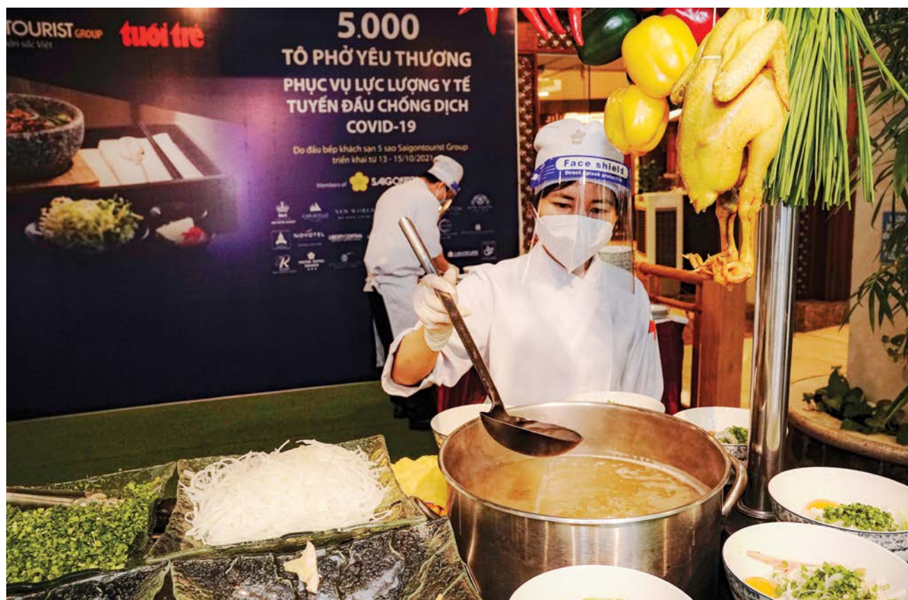
The 5-star culinary team of the Rex Hotel prepares and cooks 5,000 bowls of pho to serve the frontline medical forces fighting the epidemic

For those medical teams who were unable to directly enjoy pho at the Rex Hotel, Saigontourist Group has brought pho to the place where they were staying and served according to the taste as requested by the doctor. All of this is meant as a meaningful spiritual gift of Saigontourist Group to show gratitude to doctors and nurses after stressful working hours at field hospitals and Covid-19 patient treatment areas.