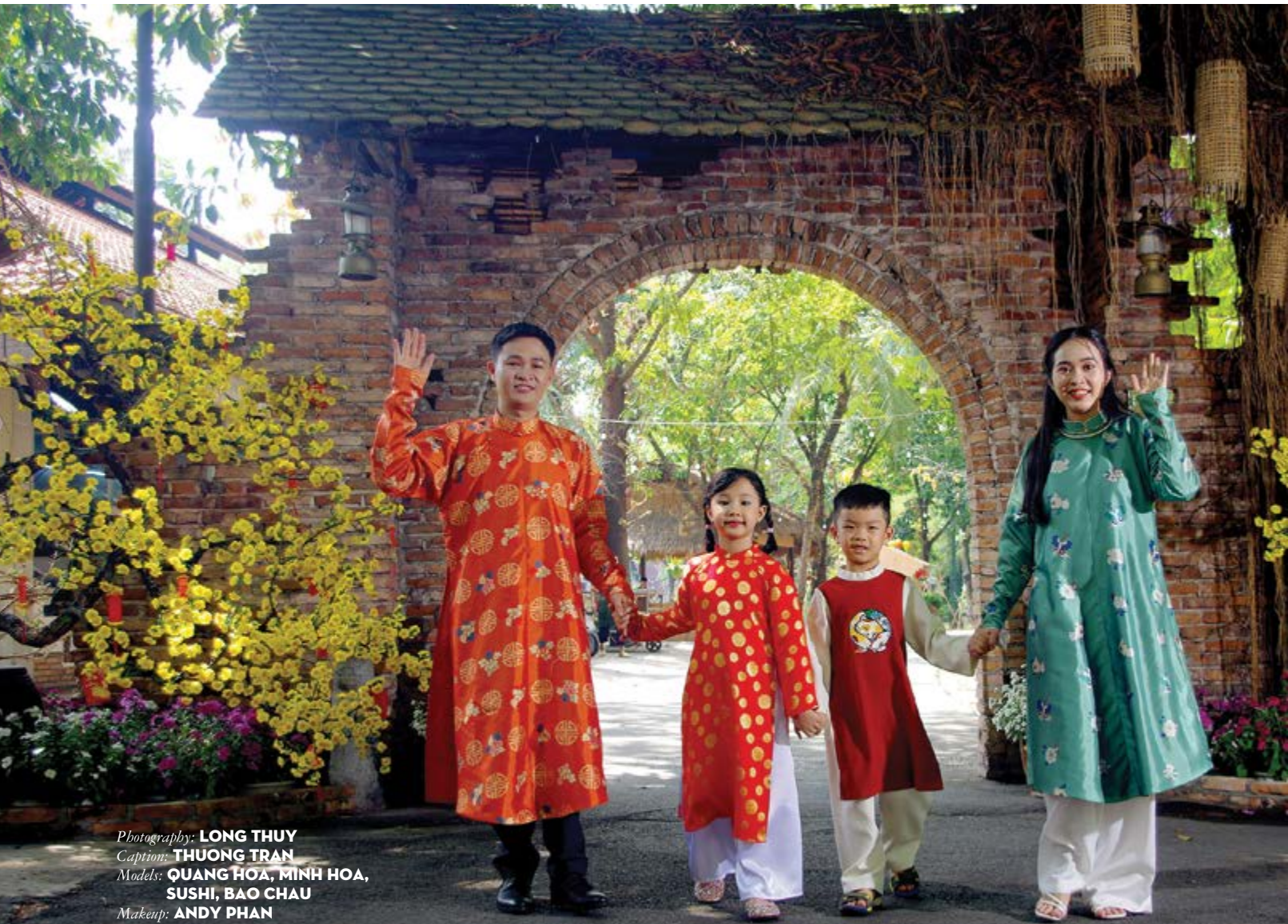
Caption: THUONG TRAN Models: QUANG HOA, MINH HOA, SUSHI, BAO CHAU Makeup: ANDY PHAN