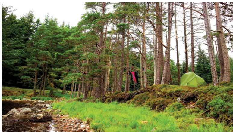
Dear Scotland appears with idyllic beauty, houses with eye-catching architecture blend in with the surrounding nature

We sipped coffee and mocha with a piece of cake at the Mint coffee featuring a mint green wall and the melodic tunes of Killing Me Softly, then we cycled around to embrace the tranquil atmosphere of Stirling. Just a few short hours after crossing through the ancient streets, I felt regret as we left Stirling without having the time to explore every corner of this land. So, I had to make an appointment with Stirling for our next reunion.